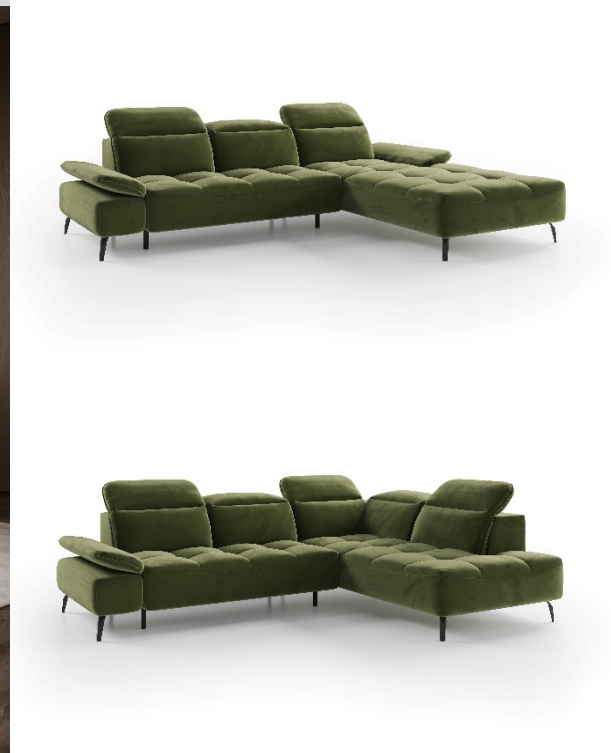
Roh otvorený L / P Motorové prehĺbenie sedu